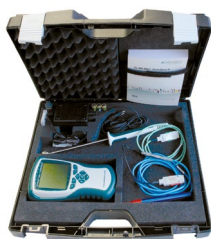
ZB 2490 TK2