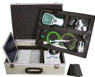
ZB 2590 TK2