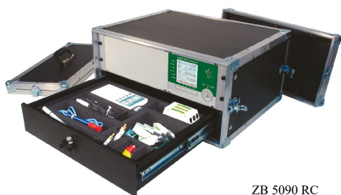
ZB 5090 RC