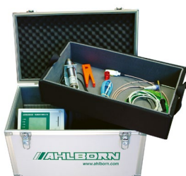
ZB 5600 TK3