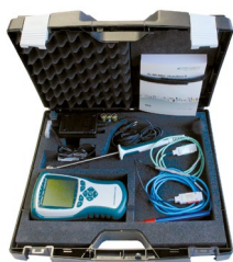
ZB 2490 TK2