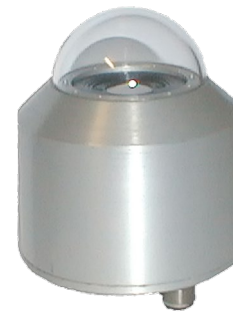
Modèle en boîtier tous temps pour utilisation en extérieur FLD7 33-UVE Fiche technique voir chapitre Météorologie