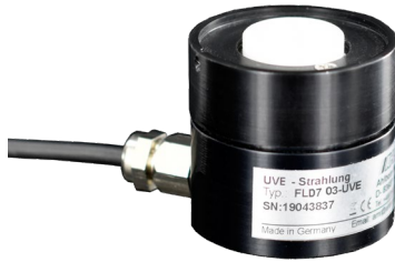
Tête de mesure du rayonnement UV ALMEMO®

Pour raccordement sur les appareils de mesure ALMEMO® V7 actuels : ALMEMO® 500, 710, 809, 202-S, 204