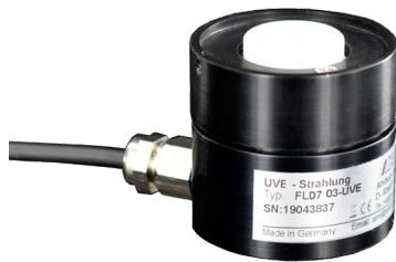
Tête de mesure du rayonnement UV ALMEMO®

Pour raccordement sur les appareils de mesure ALMEMO® V7 actuels : ALMEMO® 500, 710, 809, 202-S, 204