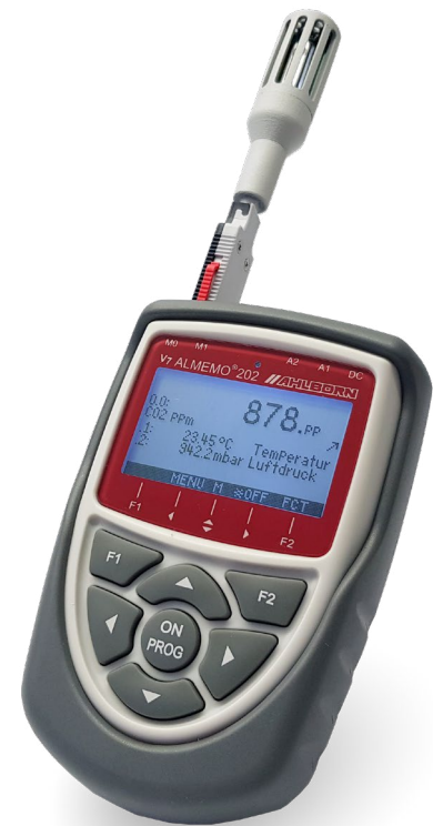
ALMEMO® Messsystem (Beispiel): CO 2 -Fühler mit Datenlogger ALMEMO® 202/204